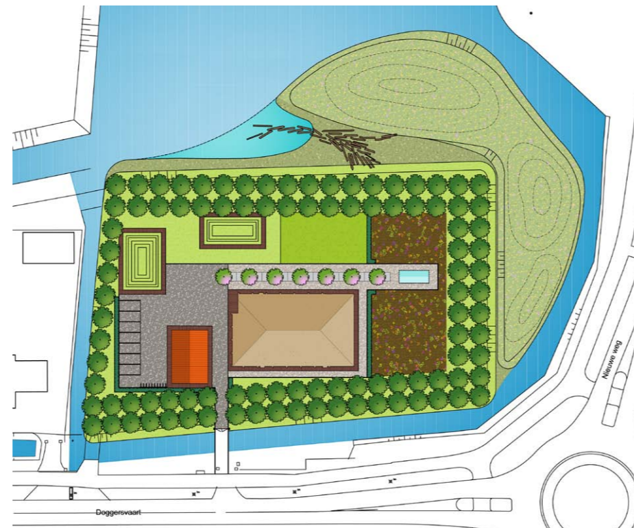
plattegrond plan DoggeRIJ (plan gemaakt door Marlies van Diest, tekening door Rachel van Esschoten)