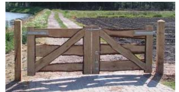
boerenhek als inspiratie